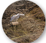
Herbe et branchages