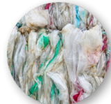
Films et sachets plastique