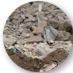
Gravats, vaisselle, porcelaine...